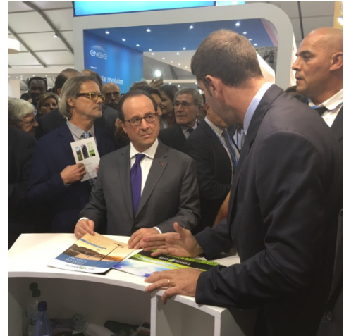
Le Parking du site de la COP22 équipé de lampadaires solaires Fonroche. Le Président François Hollande sur le stand Fonroche à la Cop22.

A Marrakech, la COP 22 accueille, depuis le 07 novembre, les principaux chefs d'Etat et acteurs du climat et de l'énergie. L'entreprise française Fonroche lighting, filiale du Groupe Fonroche et leader de l'éclairage public solaire, a remporté le projet d'éclairage des parkings de la COP22 à Bab Ighli, en partenariat avec l'Agence Marocaine Masen. François Hollande, en déplacement officiel, est venu féliciter les équipes Fonroche pour la réussite de ce projet.